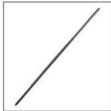
アースングロッド 30cm