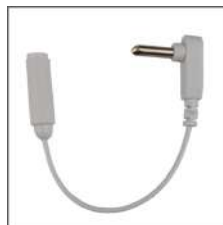
③3 口アース 接続コード