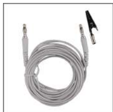
①アースコード 5m100kΩ抵抗内蔵 (ワニ口クリップ付き)