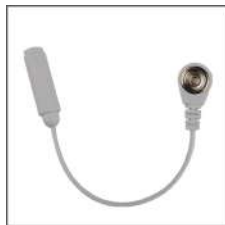
②10mm ボタン 接続コード