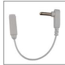
③3 口アース 接続コード