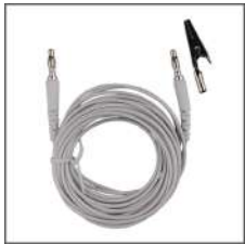
①アーシングコード 5 m100kΩ抵抗内蔵 (ワニ口クリップ付き)