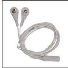
②ボタン分岐 コード