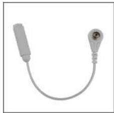
②4mm ボタン 接続コード