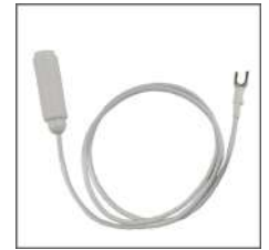
④ネジ式アース 接続コード