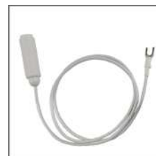
①アースコード (ワニ口クリップ付き) ・バス用コード 3 m ・アースロッド 30cm ・吸盤 (2 個)